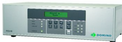
PCU III (Unité de contrôle d'impression)